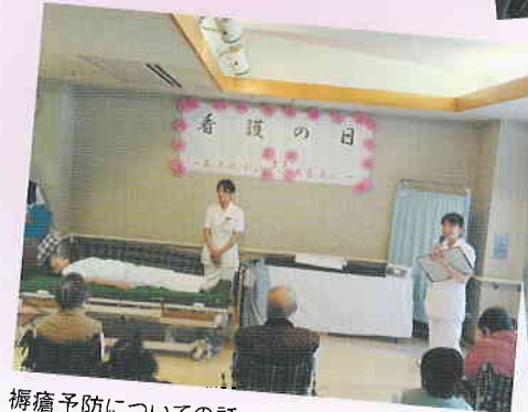
褥瘡予防についての話