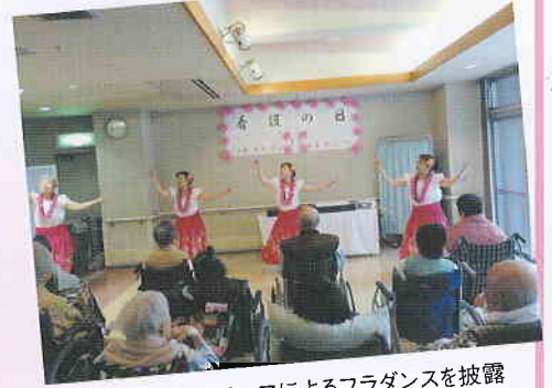
スタッフによるフラダンスを披露