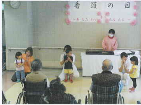
病院保育所の園児による遊戯