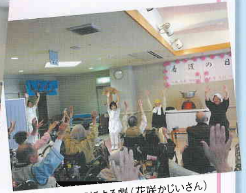
スタッフによる劇(花咲かいさん)